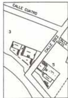
Localización de la Empresa