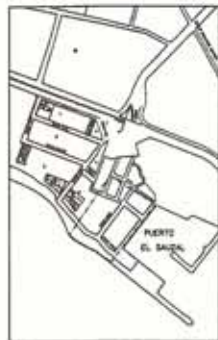
Localización de la empresa en el Parque Ind. FONDEPORT